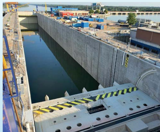
Rekonstrukce vodního díla Gabčíkovo, Slovensko