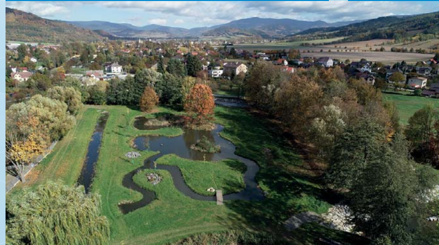
Příroděblízká protipovodňová ochrana na řece Desné – povodňový park