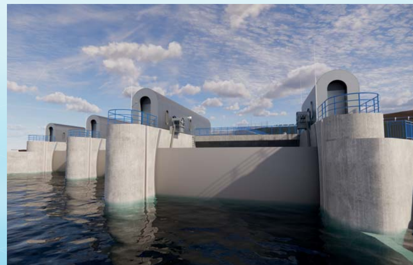
Vodní dílo Orlik – vizualizace BIM