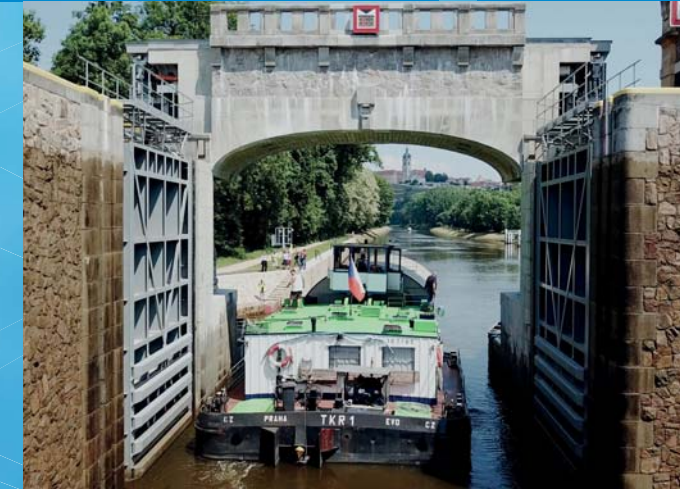
Plavební komora Hořín