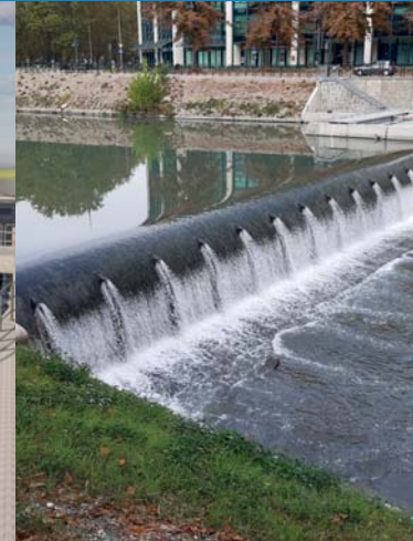
Vakový jez v Turině, Itálie