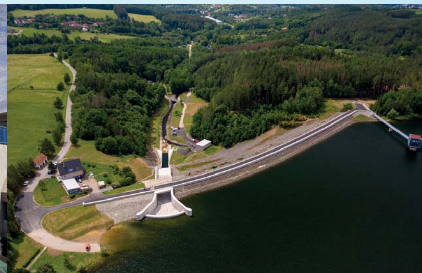
Vodní dílo Boskovic