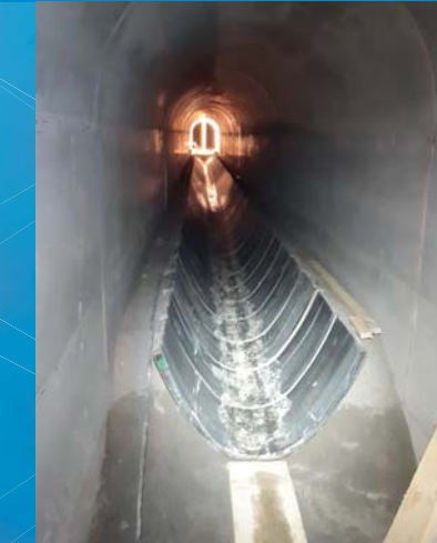
Rekonstrukce kanalizace Solniční